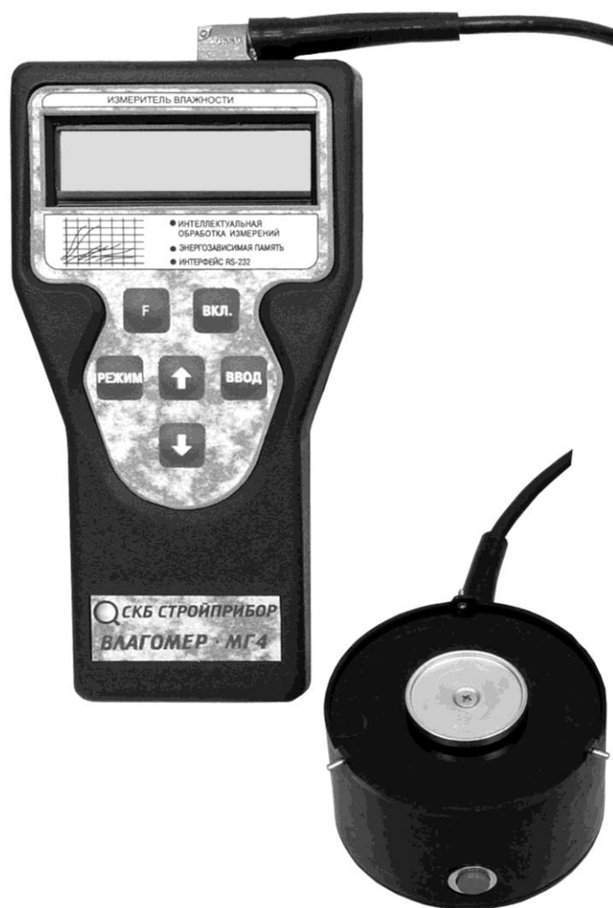
Рисунок 1 - Общий вид Влагомера-МГ4-Д

1.4.2 Влагомер состоит из преобразователя и электронного блока, имеющего на лицевой панели двухстрочный цифровой дисплей, и клавиатуру, состоящую из 6 кнопок: «ВКЛ.», «РЕЖИМ», «↑», «↓», «ВВОД», и «F». В верхней торцевой поверхности корпуса размещено гнездо соединительного разъема для подключения датчика влажности. Элементы питания размещены под крышкой батарейного отсека на задней стенке электронного блока.